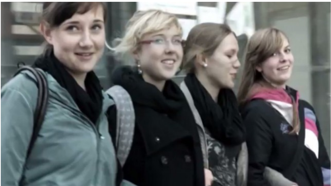
Standbild aus KOMA: gut ausgeleuchtete Gesichter betonen die fröhliche Stimmung.

Wie bei der Nutzung verfügbaren Lichts gilt auch hier, dass die Beleuchtung eines Gesichts von nur einer Seite, ein Gesicht plastischer erscheinen lässt.