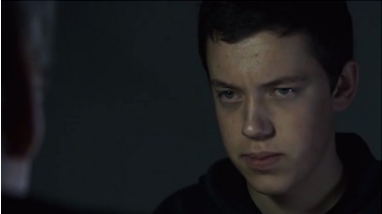
Standbild aus KOMA: low-key erzeugt eine düstere Stimmung.

In künstlerischen Formaten wird das Licht meist auch gezielt eingesetzt, um eine bestimmte Wirkung bzw. Lichtstimmung zu erzielen. Wenn man den Drehort eher wenig ausleuchtet, kann z.B. eine dramatische oder düstere Stimmung entstehen. Dann spricht man auch von dem sog. Low-Key, das z.B. auch für das Genre des „Film noir“ oder den zeitgenössischen „Neo-noir“ typisch ist.