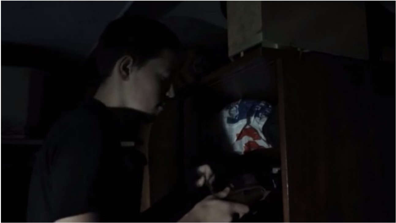
Standbild aus KOMA: ein dunkles Gesicht erzeugt eine angsteinjagende Stimmung.