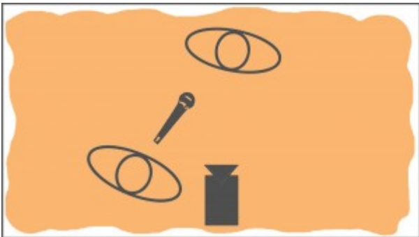
Položaj kamere, mikrofona, novinarja in intervjuvanca – snemano z leve in desne.