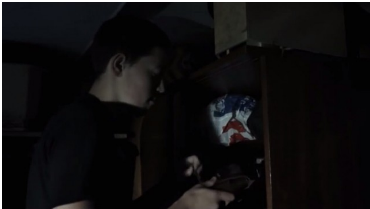
Fotografija iz filma KOMA: Temni obraz ustvari strašljivo vzdušje