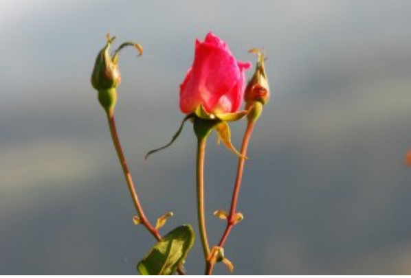
18 mm lens ile çekilmiş bir fotoğraf (zoom-out) ve yine aynı kare 200 mm lens ile çekilmiş bir fotoğraf (zoom-in)