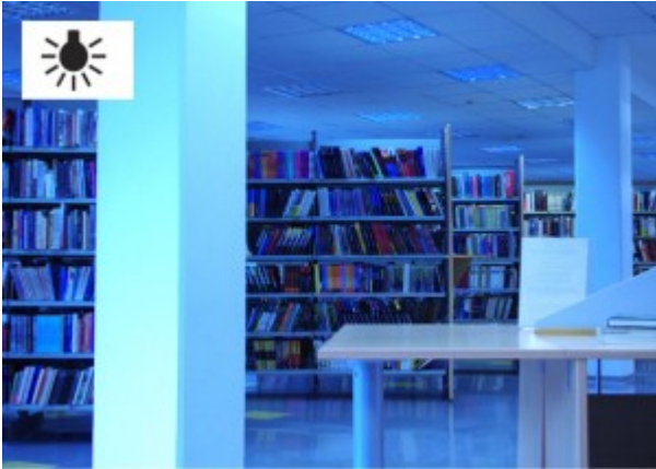
farklı WB kullanımı