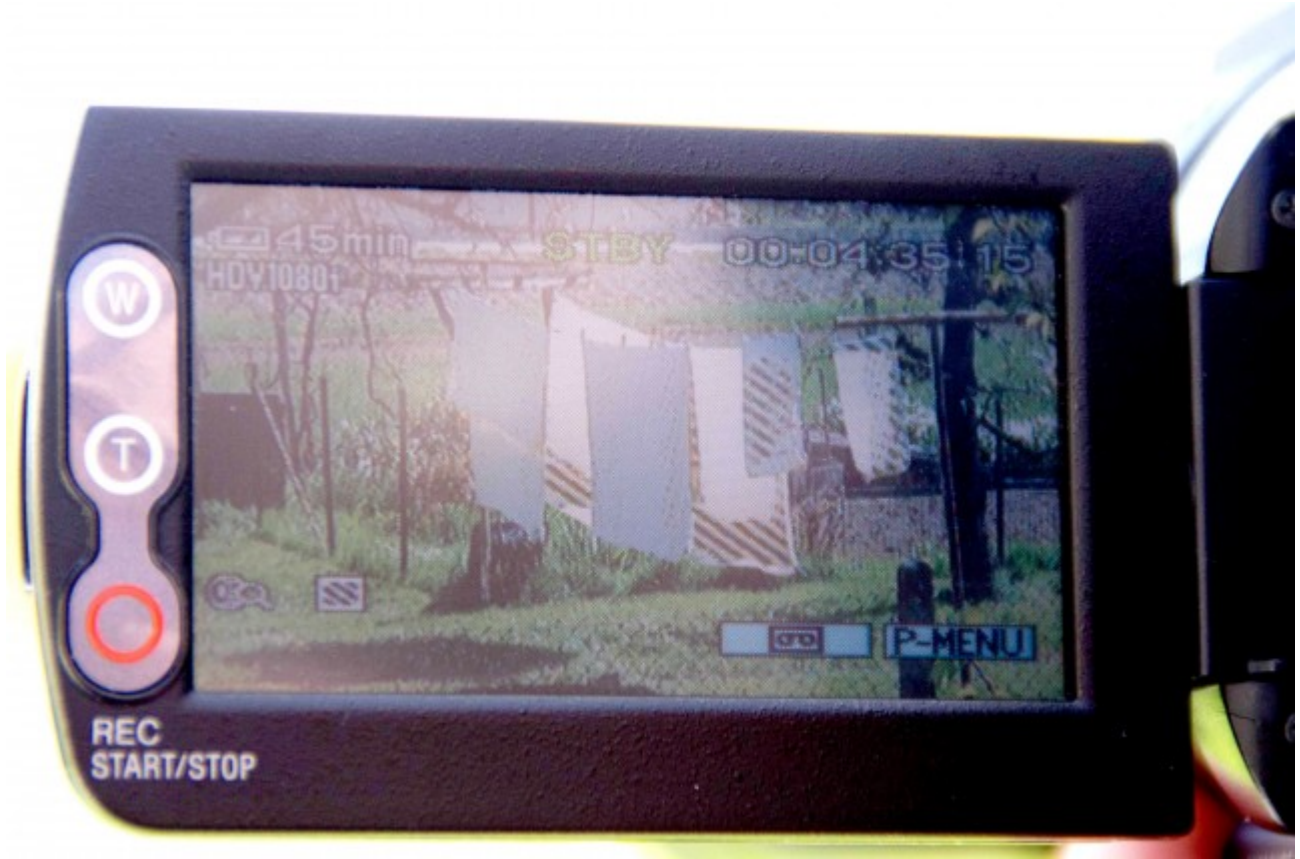
Zebra özelliği ekran üzerinde parlak yüzeyleri işaretler

Kameranızda çekim yaparken açıklığı düşürmeniz daha az ışık almanıza neden olur ve zebra uygulamasını ekranda daha net görürsünüz.